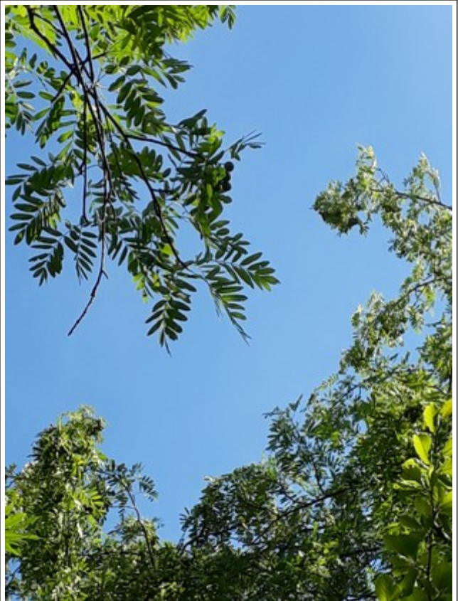
25. Jul 2020