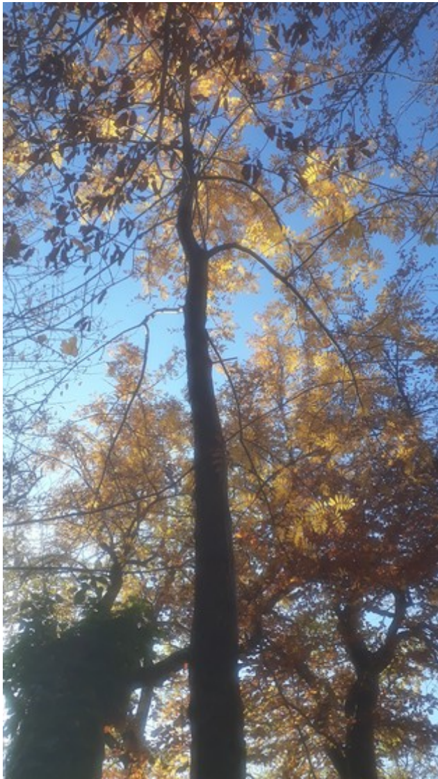
7. Nov 2018