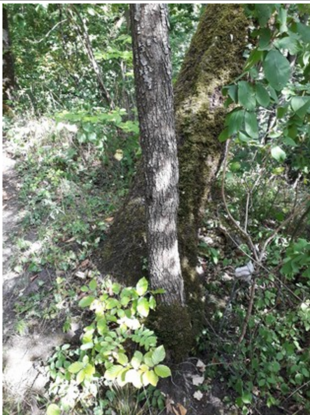
25. Jul 2020