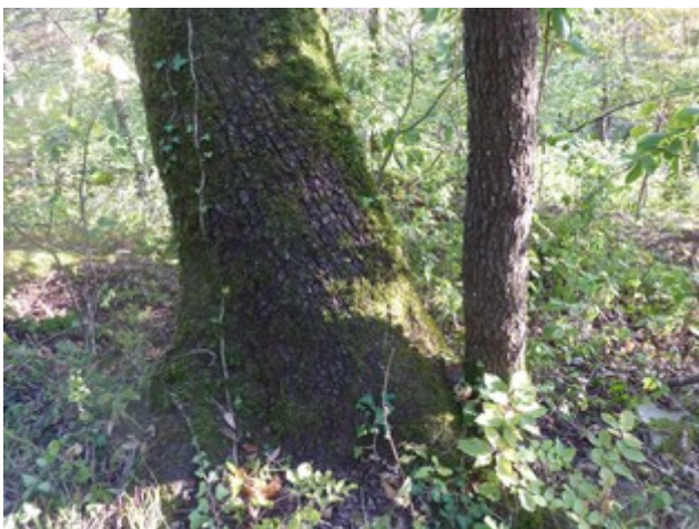
20. Sep 2019