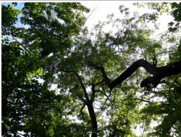
25. Jul 2020