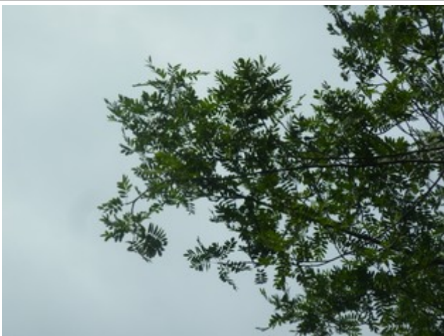
26. Jul 2020