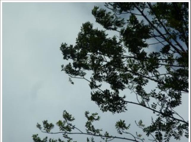
26. Jul 2020