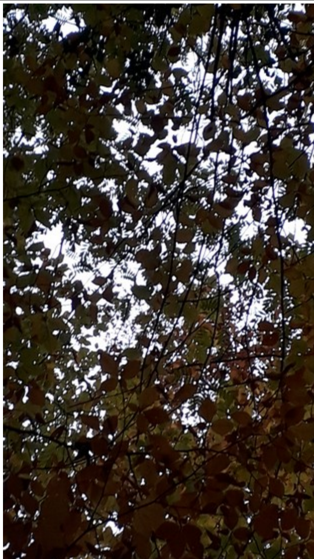
3. Nov 2018

6. Mai 2021: Efeu wurde am Stammfuss durchgesägt.