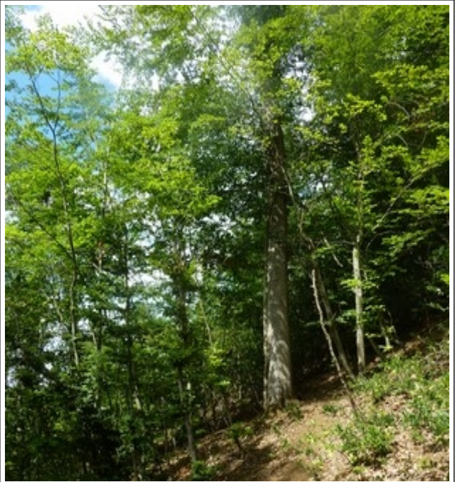
26. Jul 2020