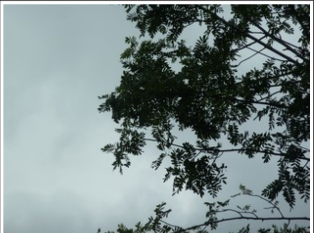
26. Jul 2020