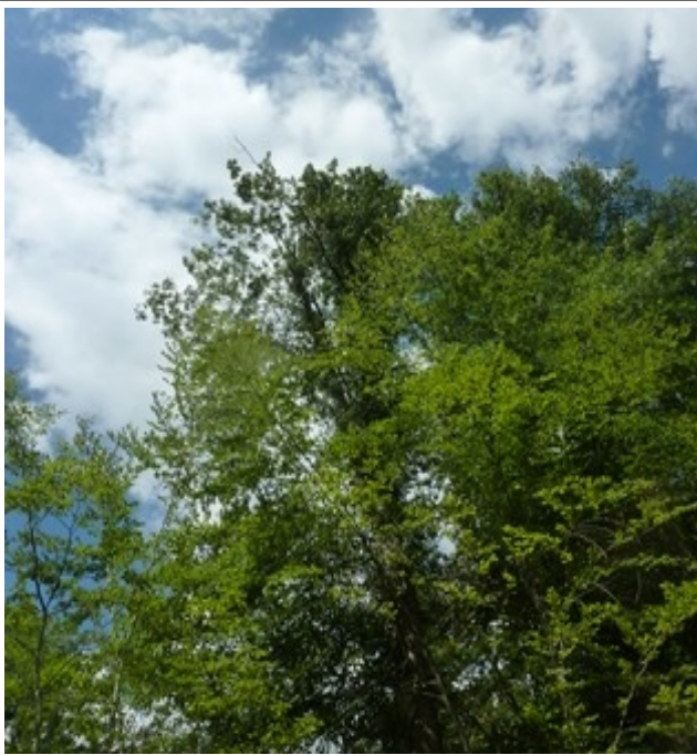
26. Jul 2020