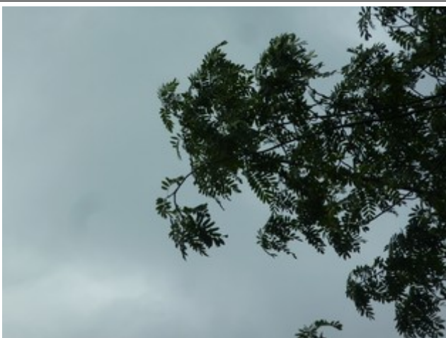
26. Jul 2020