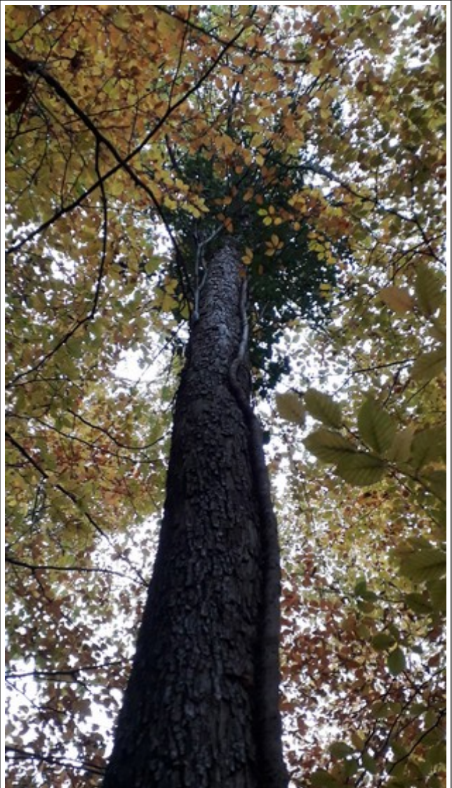
3. Nov 2018