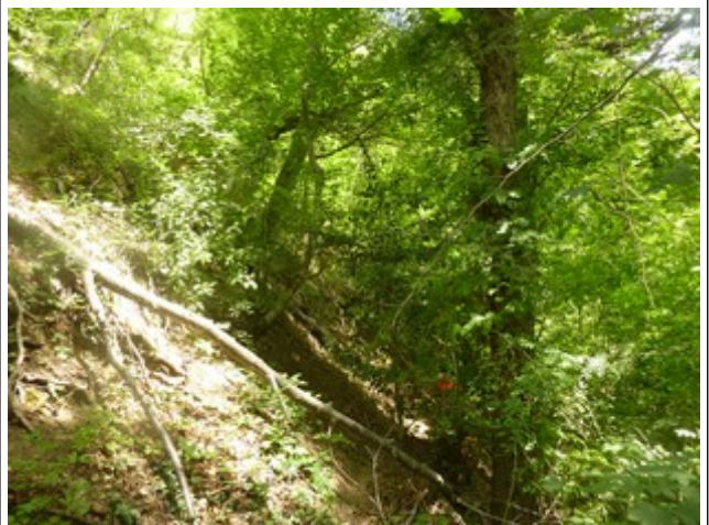
10. Juli 2020