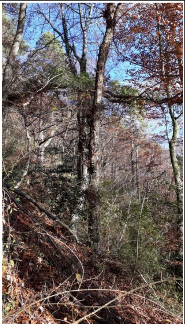
24. Nov. 2018