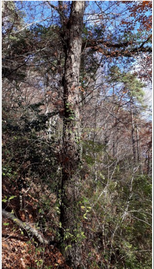
24. Nov. 2018