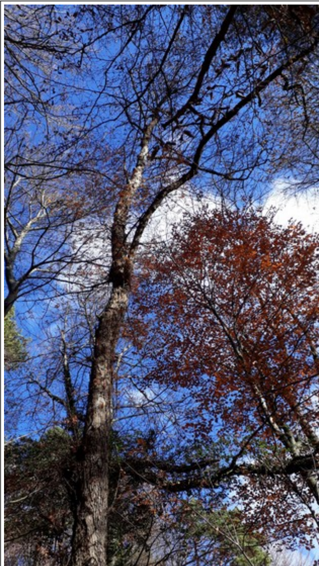
24. Nov. 2018